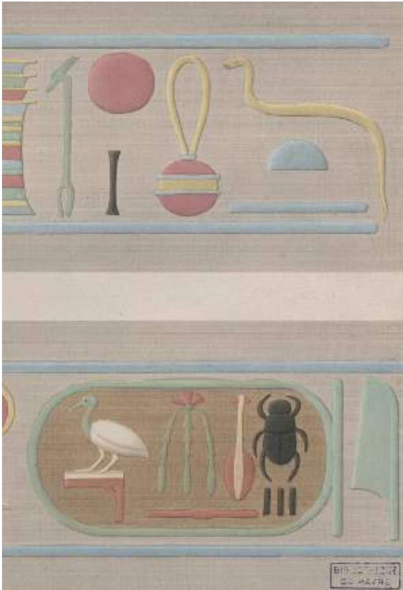
Edme François Jomard et al. , La Description de l'Égypte , Paris, Imprimerie impériale, 1809 Le Havre, Bibliothèque municipale, 34