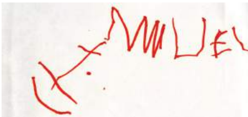
Samuel, [Prénom], 2018 Collection particulière

En classe, on dit aussi que le X a la forme d'une croix... Mais il faut expliquer aux enfants la distinction : cette lettre, ça rappelle une échelle, mais c'est la lettre E.