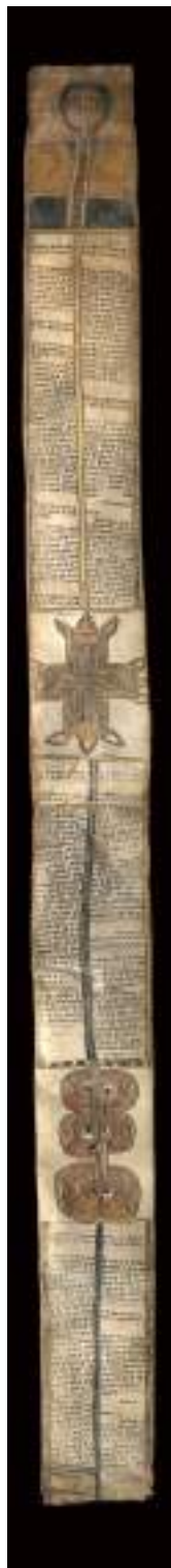
Talisman éthiopien, XIX e siècle Rouleau de parchemin de deux bandes de parchemin cousues, 1400 x 115 mm Le Havre, Bibliothèque municipale, ms 555