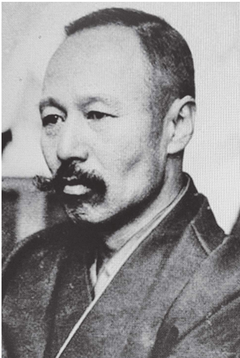
Portrait photographique d'Ōgai Mori (Mori Rintarō), le 22 octobre 1916 (49 ans) Tokyo, Kokuritsu Kokkai Toshokan, (National Diet Library)