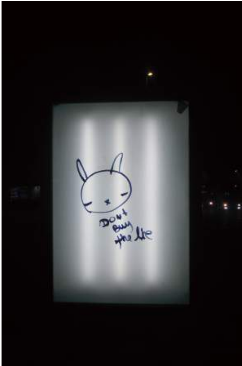
Sébastien Morlighem, Vegan Bunnies , graffiti, Barcelone, décembre 2013 Cliché numérique. Avec l'aimable autorisation de l'auteur