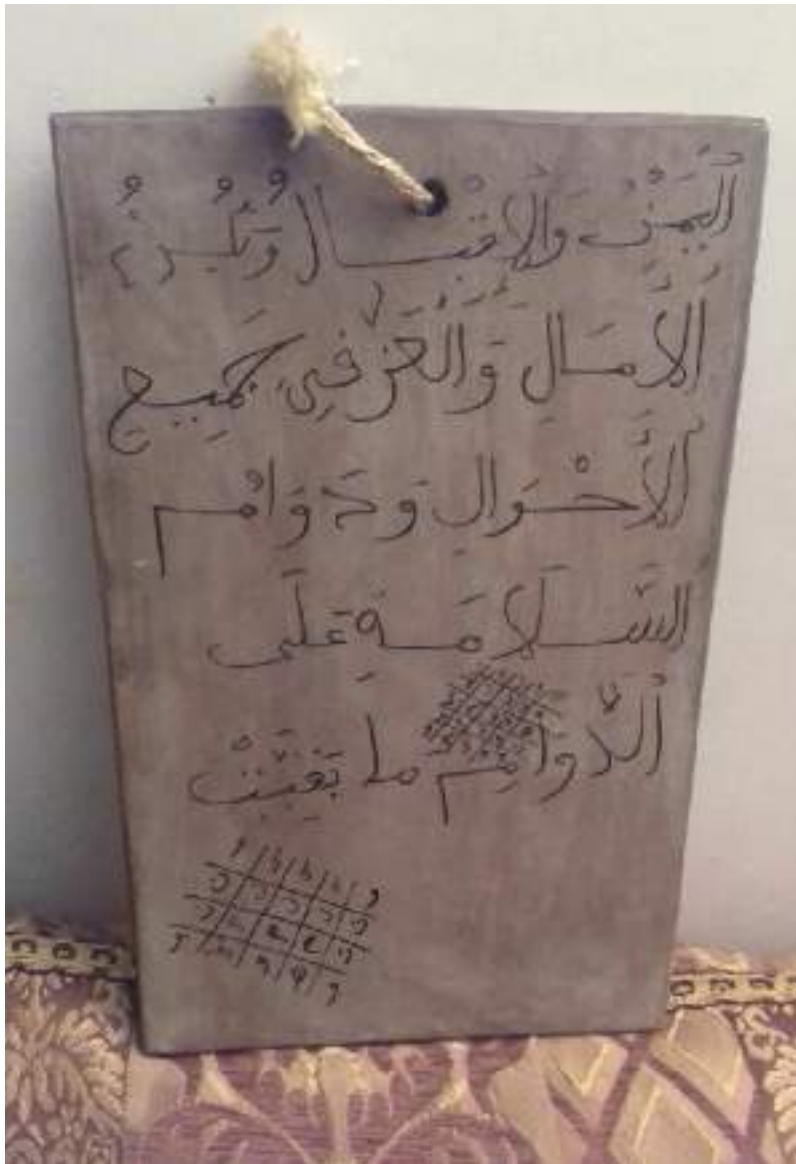
Ahmed Farouk, Tablette-talisman , 2017 Photographie numérique. Avec l'aimable autorisation de l'auteur