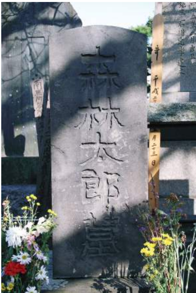
Sora Mi Mi, Tombe de Mori Rintarō dans le temple Yomeiji , 2017 Photographie numérique. Licence Creative Commons 4.0