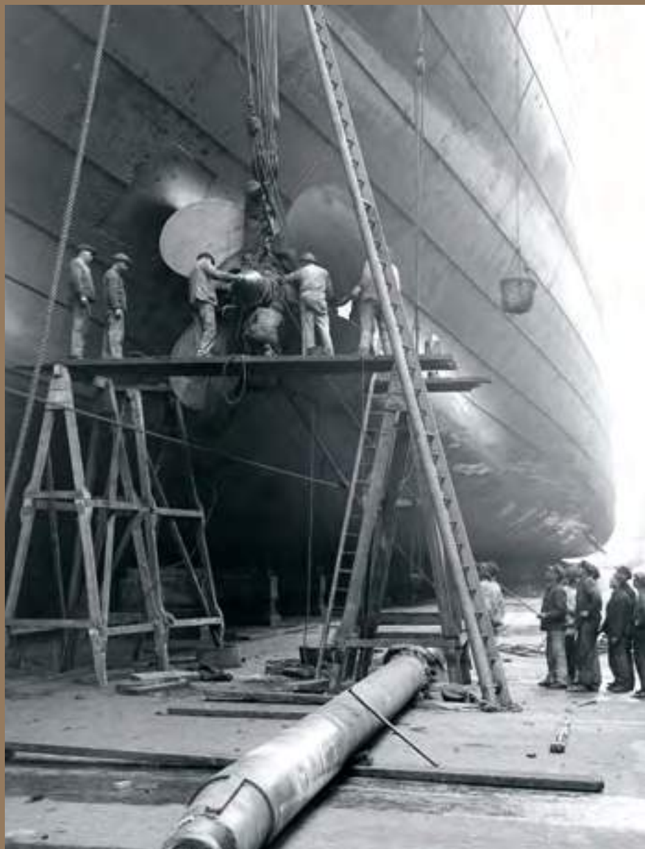
Ouvriers changeant l'arbre à hélice du paquebot Ile-de-France, dans la forme de radoub n°7, port du Havre, Le Havre, 1927. Le Havre, Bibliothèque municipale, Ph PLQ GRD 0011.