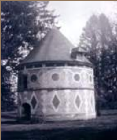
Marcel Maillard, Château de Crameshnil à Saint-Vincent- Crameshnil , 22 mars 1925

Le Havre, Bibliothèque municipale, PH MM F 033.7