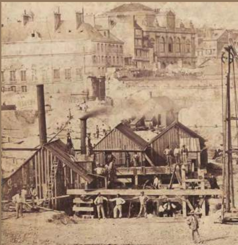
Jean-Victor Warnod, Le Havre, travaux d'aménagement de la jetée , 1861. Le Havre, Bibliothèque municipale, PH 01.