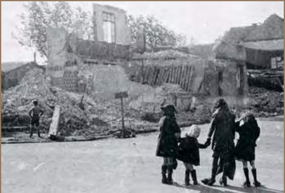
Will, Autres ruines, autres deuils... à l'école des Neiges, Le Havre, 12 septembre 1944. Le Havre, Bibliothèque municipale, Ph Will NEGA 0254