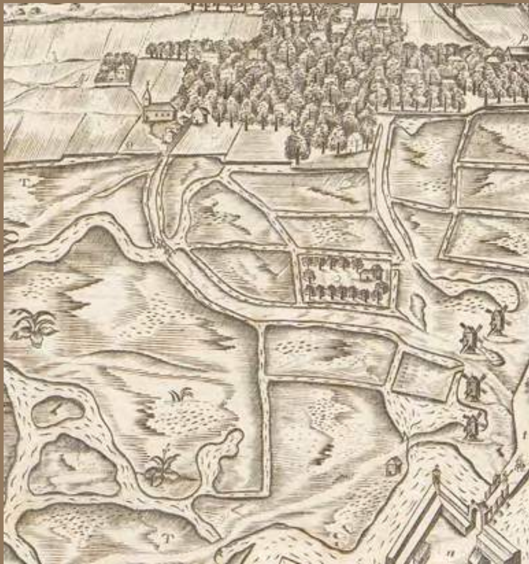
Vincent Hantier, Plan de la ville et citadelle du Havre de Grace , Le Havre, 1673. Le Havre, Bibliothèque municipale, EST G 39