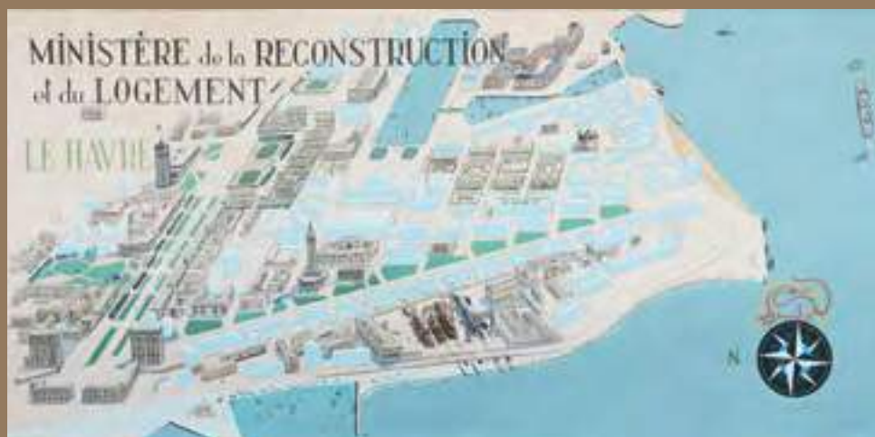
Ministère de la reconstruction et du logement, Le Havre, février 1955-1956.