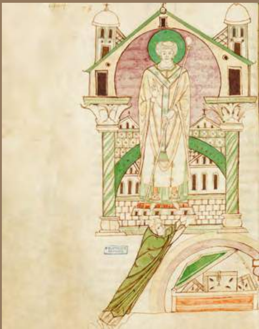
Chronicon majus Fontanellae , Miniature représentant Saint Ansbert. À ses pieds, un coffre avec trois livres, vers 1075. Le Havre, Bibliothèque municipale, Ms 332