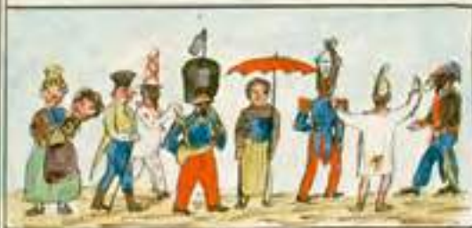
une fête de masques