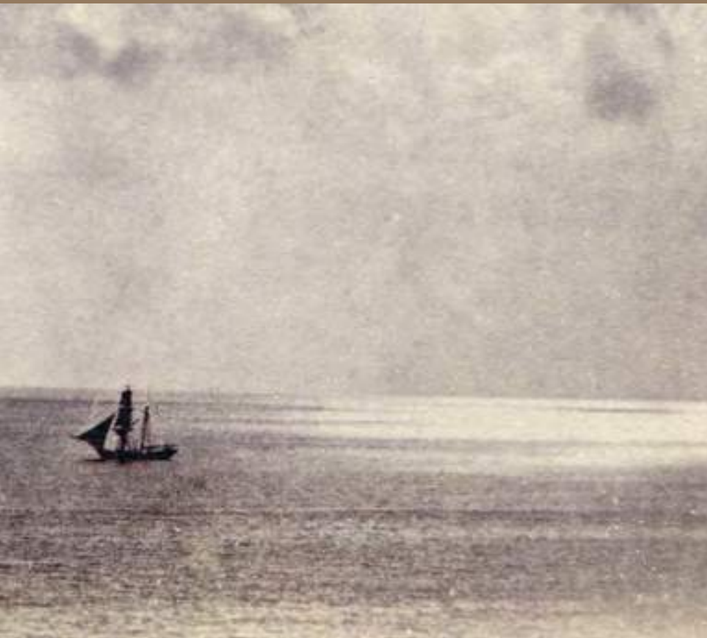
Gustave Le Gray, Brick au clair de lune, Au Havre : Au pavillon vert. Kaiser, 1856 Le Havre, Bibliothèque municipale, Ph 596